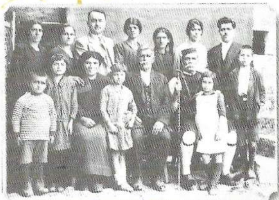
Μικροχωρίτικη οικογένεια στις αρχές του 20 ου αιώνα

Η ΜΑΡΤΥΡΙΑ ΕΝΟΣ ΣΥΜΜΑΧΗΤΟΥ Στὴν πόλιν τοῦ χωριού... ΟΙ ΜΙΚΡΟΧΩΡΙΤΑΙ ΚΑΙ ΤΑ ΕΠΙΤΥΓΜΑΤΑ ΤΩΝ ΜΕΤΑ ΤΗΝ ΚΙΝΗΣΙΑΤΙΚΗΝ ΚΑΤΑΣΤΑΣΙΝ 1) Ἡ ἀνάγκη τοῦ ἱεροῦ Μονῆ ἡ Μεταμόρφωσις τοῦ ναοῦ καὶ ἡ ἔκτισις Ἀθανάσιου Παλατίου 2) Ἡ εἰσφορά ἡμετέρας Χαρῆ καὶ ἡ ἀνάγκη 3) Ἡ εἰσφορά ἡμετέρας ἀπομιμνήσκου 4) Ἡ ἀνάγκη τοῦ ναοῦ τοῦ ἀπομιμνήσκου 5) Ἡ ἀνάγκη τοῦ ναοῦ τοῦ ἀπομιμνήσκου