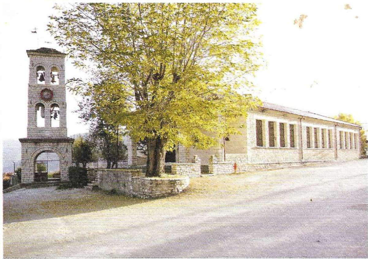
Παλιό Μικρό Χωριό