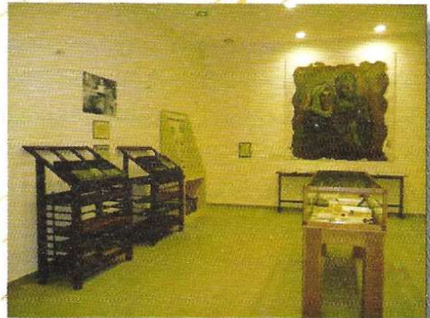
Από τους εκθεσιακούς χώρους του Μουσείου