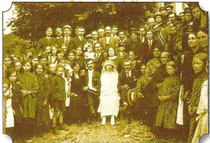
Αρχές του 20 ου αιώνα. Αναμνηστική φωτογραφία γάμου