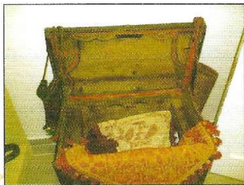
Κασέλα ζωγραφιστή του 19 ου αιώνα